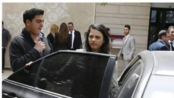
הנתן אשל של איילת שקד: הראיות שלא נחקרו על האיש שקידם את דיל החסינות

113. הובאה גם דוגמא עדכנית לכך שבאתר הופיעה המלצת תוכן ממומנת של חברת Taboola ובה קישור לפרסום בפורום על דרך של כותרת הפרסום, תמונה, ושמו של אתר רוטר, בעוד מדובר בכתבה שהועתקה מאתרי התובעת באוגוסט 2019 (סע' 86 לתצהיר קודנר, מ/68).